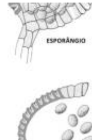
Afirmção 1 A