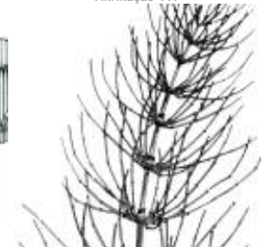
Afirmção 5 A