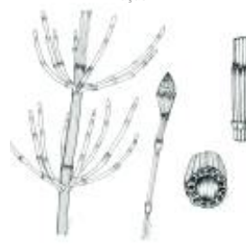
Afirmção 4 A